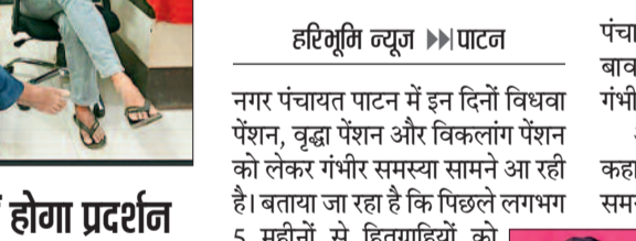
हरिभूमि न्यूज ►► पाटन