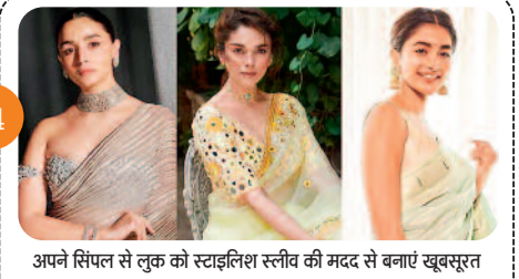
अपने सिंपल से लुक को स्टाइलिश स्लीव की मदद से बनाएं खूबसूरत